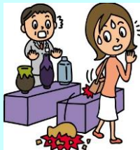
買い物中、誤って商品を壊してしまった。