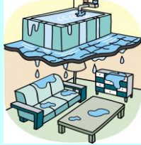
アパートで、風呂場の水があふれて、階下の部屋を汚した。