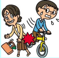
自転車を運転中、誤って歩行者と接触し、ケガをさせた。