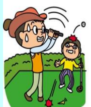
打ったゴルフボールで誤って他人を失明させた。